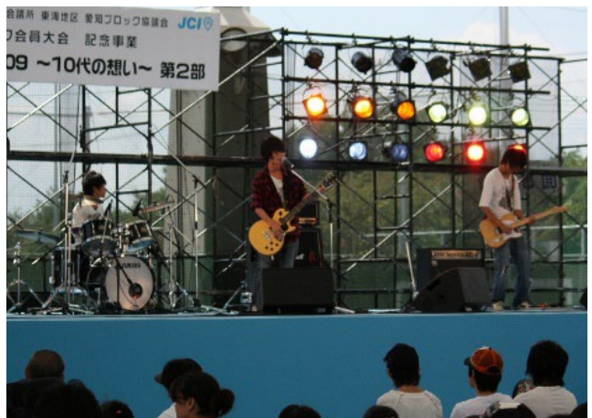
高校生出場者の熱気あふれる演奏（碧南市臨海公園にて | 2009年）