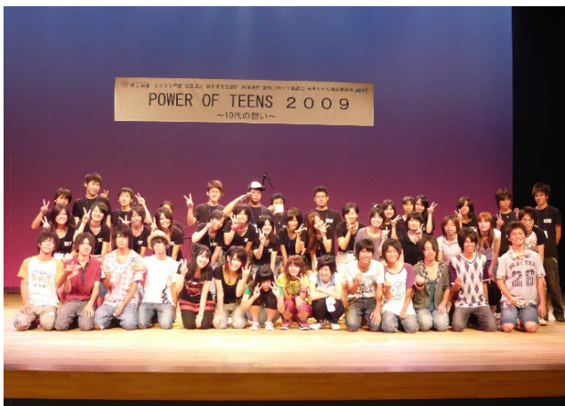
高校生出場者とスタッフ（アートピアホールにて | 2009年）