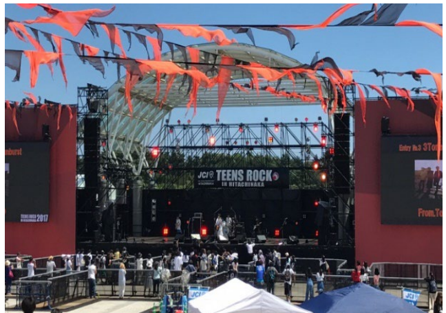
TEENS ROCK IN HITACHINAKA（国営ひたち海浜公園 | 2017年）