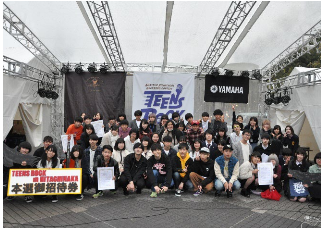
大会後の記念撮影（エディオン久屋広場にて | 2019年）

2017年、TEENS ROCK IN AICHI の優勝者「プランクトン（愛知県立旭丘高等学校）」がひたちなか大会でも優勝し、愛知のバンドとして、初めて「ROCK IN JAPAN FES.」のステージに立ちました。2018年は TEENS ROCK IN HITACHI NAKA が台風のため中止、2020年は TEENS ROCK IN AICHI が感染症拡大による出場者の辞退が相次ぎ中止となりました。