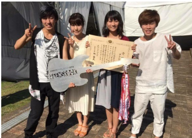
文部科学大臣賞と ROCK IN JAPAN の出演をはたした「プランクトン」